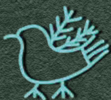
symbol nowych wiadomości

Czy wiesz, że... w dawnych czasach każdy klan miał swój własny, niepowtarzalny totem? Totemem była najczęściej drewniana rzeźba lub rysunek wybranego zwierzęcia, rośliny lub przedmiotu, uznawanego za uosobienie mitycznego przodka i opiekuna danej rodziny. Totem był otaczany czcią i stanowił jeden z symboli przynależności do danego rodu.