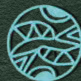
symbol połączonych światów